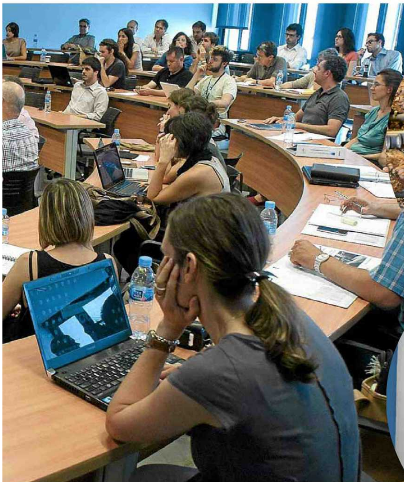
Los ganadores del Momentum Project, en una sesión de formación en Esade Creápolis.