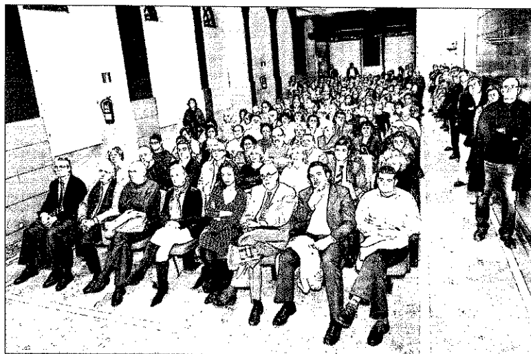
Lleno en el auditorio do Areal para oír la charla sobre el día después de la crisis.

dad Social debido a la crisis podrían quebrar el sistema de pensiones en doce años, 1922. Las nuevas afiliaciones de los inmigrantes a la Seguridad Social resolvieron por un tiempo, junto al auge de la economía, la cobertura de las nuevas pensiones, pero la crisis ha caído en los mismos males de las grandes reconversiones de los 80 y 90: las jubilaciones anticipadas, que están cercenando la lucha".