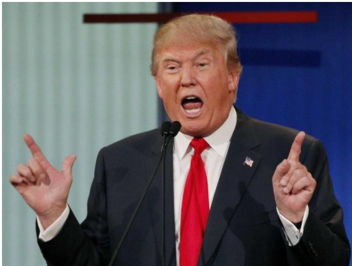
Fomento de valores