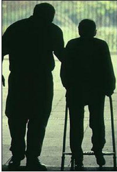
Organizaciones del conocimiento