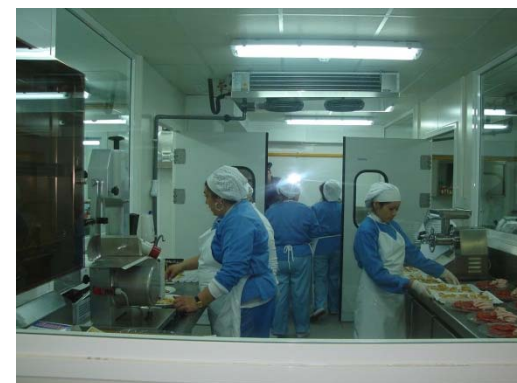
Salta, empresa de inserción laboral de la fundación Ared