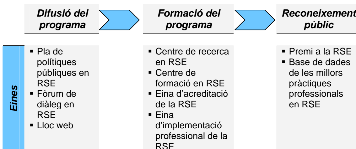
Figura 2: Procés i eines per a la implementació completa d'un programa de RSE

La difusió del programa a les pimes s'hauria de dur a terme per mitjà de la xarxa multi-stakeholder i d'una campanya pública, seguides d'un díptic informatiu en forma de guia completa del programa i de formació específica adreçada a pimes. El pas final, en aquest model ideal, seria una campanya pública i un reconeixement per a les pimes que completessin amb èxit el programa. Els onze programes que descrivim són representatius de les diferents eines que hem exposat aquí. Si bé la majoria dels governs només fan servir una eina o una altra, recomanem utilitzar-ne una combinació per tal de dur a terme un programa complet adreçat a pimes.