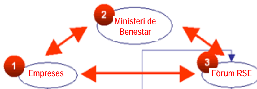
Figura 3: Pla del procés de les polítiques públiques