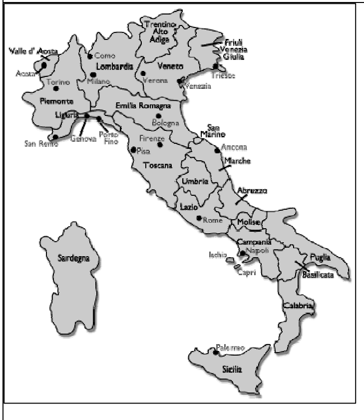
Figura 2: Mapa político de Italia

La figura 2, Mapa político de Italia, es una presentación visual de los límites geográficos del mapa político. De 1992 a 1997, Italia afrontó unos retos importantes, cuando los votantes, desencantados por la anterior parálisis política, la deuda masiva del gobierno, la corrupción generalizada y la gran influencia del crimen organizado –denominado colectivamente Tangentopoli, tras ser descubierto por Mani pulite–, exigieron reformas políticas, económicas y éticas. Una serie de coaliciones de centroizquierda dominaron el panorama político italiano entre 1996 y 2001. En abril de 1996, las elecciones nacionales dieron la victoria a una coalición de centroizquierda, El Olivo, liderada por Romano Prodi. El gobierno de Prodi se convirtió en el tercero más duradero en el poder antes de que perdiera, por el estrecho resultado de tres votos, una moción de confianza en octubre de 1998. Las elecciones nacionales del 23 de mayo de 2001 restituyeron a Berlusconi en el poder al frente de una coalición de centroderecha formada por cinco partidos, la "Casa de la Libertad", que incluía el propio partido del primer ministro, Forza Italia, la Alianza Nacional, la Liga Norte, el Centro Cristianodemócrata y los demócratas de la Unión de Centro