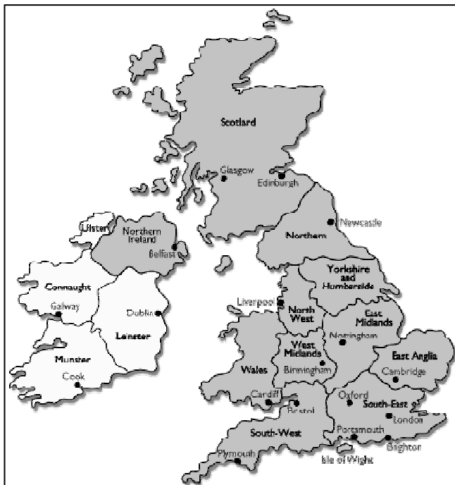
Figura 2. Mapa político del Reino Unido

La figura 2, Mapa político del Reino Unido, es una representación visual de los límites geográficos del mapa político. En el Reino Unido predomina el bipartidismo político, formado por el Partido Conservador y el Partido Laborista. En los ochenta, el Gobierno del Partido Conservador impulsó un programa de privatizaciones y transfirió una gran parte de la responsabilidad del sistema público al sector privado. La contribución tributaria es inferior a la de la Unión Europea, con el 37,4 %. El Estado no es intervencionista, y permite la autorregulación del mercado (Andersen, 2001). El Reino Unido también tiene un sector de voluntariado muy consolidado. Noll (2003) clasifica el Reino Unido como un país centroeuropeo donde existe una división de las responsabilidades sociales entre los sistemas público y privado.